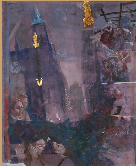
Miloslav Čech, Plzeň vánoční, 2013, olej na sololitu, 120 x 100 cm

NA VÝSTAVĚ V KATEDRÁLE SV. BARTOLOMĚJE A V KOSTELE SV. JANA NEPOMUCKÉHO V PLZNI