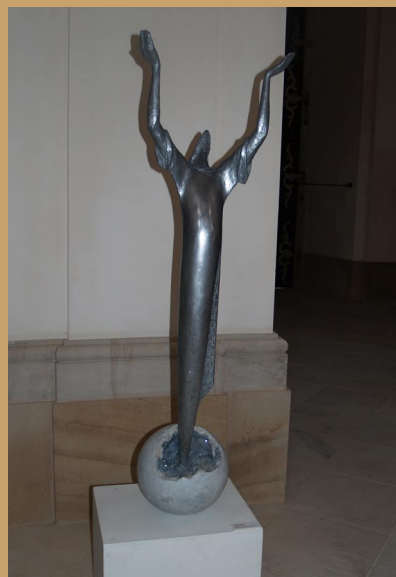
František Bálek, Oroduj za nás, 2013, výška 120 cm, komb. technika

PODĚKOVÁNÍ MĚSTU PLZNI, ODBORU KULTURY MMP ZA POROZUMĚNÍ A PODPORU LETNIC UMĚLCŮ 2014