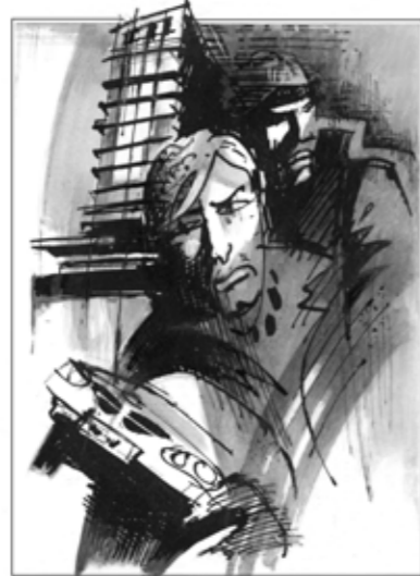
Novinové kresby ke kriminálním příběhům