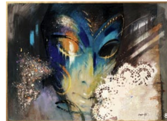
6. VEJDI, akryl, 2013 7. REJŠTEJN, tempera, 2014 8. KONEC PLESU, akryl, 2015 9. SEN, tempera, 2009 10. AFRICKÁ MADONA, komb. technika, 2012