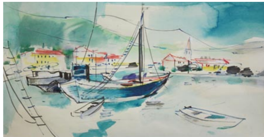
MAKARSKÁ, akvarel, konec 70. let