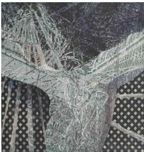
Bedřich Kocman, Bez názvu, 2012, 120 × 120 mm, línoryt

K té běžné činnosti také potřebuje schopnosti a Boží dary; k vědě a umění však potřebuje Boží inspiraci a mimořádné nadání.