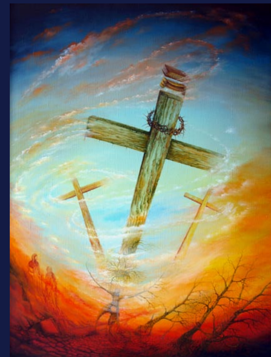
Jiří Vlach, Trojice, 2012, 100 × 75 cm, olej na plátně

MĚSTO PLZEŇ BISKUPSTVÍ PLZEŇSKÉ KONZERVATOŘ PLZEŇ STŘEDISKO ZÁPADOČESKÝCH SPISOVATELŮ UNIE VÝTVARNÝCH UMĚLCŮ PLZEŇSKÉ OBLASTI