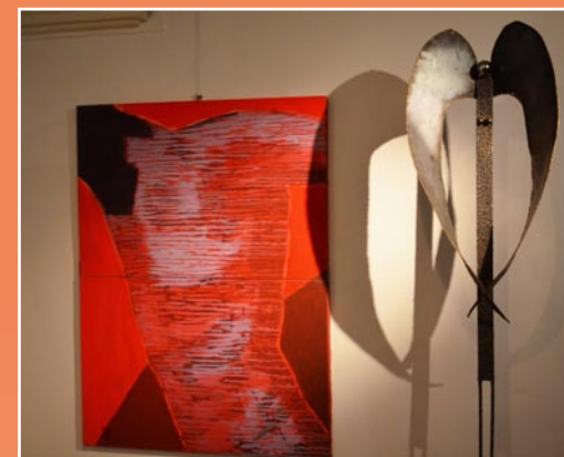
Z výstavy členů UVU Plzeň v Muzeu církevního umění

MĚSTO PLZEŇ UNIE VÝTVARNÝCH UMĚLCŮ PLZEŇ BISKUPSTVÍ PLZEŇSKÉ ŘEK FARNOST PŘI KATEDRÁLE SV. BARTOLOMĚJE V PLZNI STŘEDISKO ZÁPADOČESKÝCH SPISOVATELŮ KONZERVATOŘ PLZEŇ ZÁPADOČESKÉ MUZEUM V PLZNI MUZEUM CÍRKEVNÍHO UMĚNÍ PLZEŇSKÉ DIECÉZE