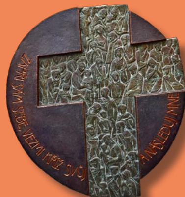
Jaroslav Veselák, A následuj mne, plastika – epoxid, 2016